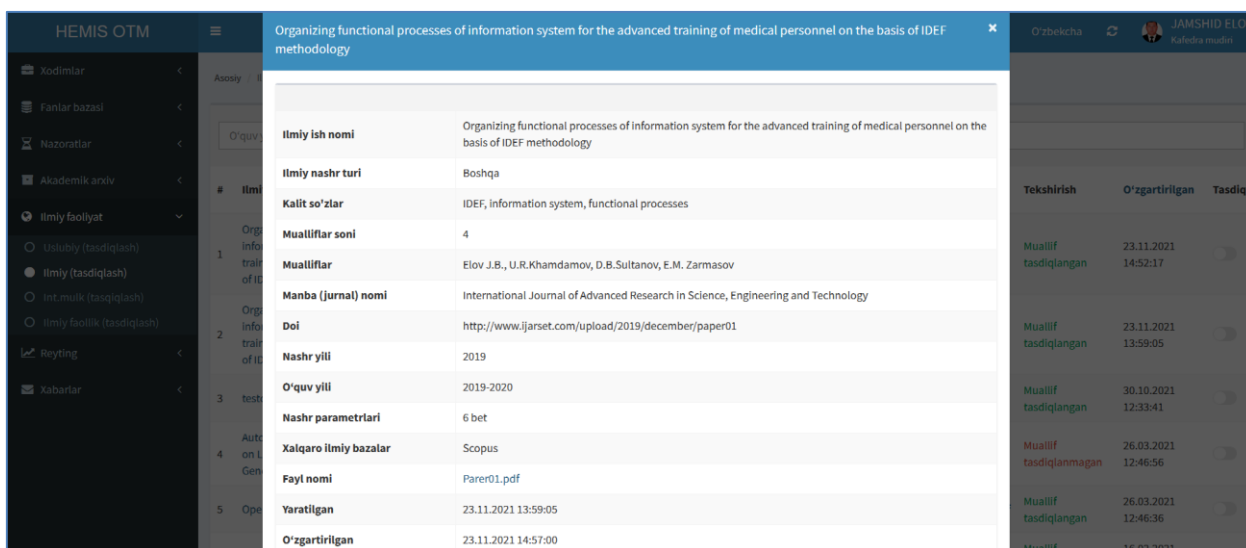
2-расм. Илмий нашр маълумоти

Илмий нашрлар рўйхатидан нашр номини танлаш орқали илмий нашр тўғрисидаги маълумотни кўринг (2-расм).